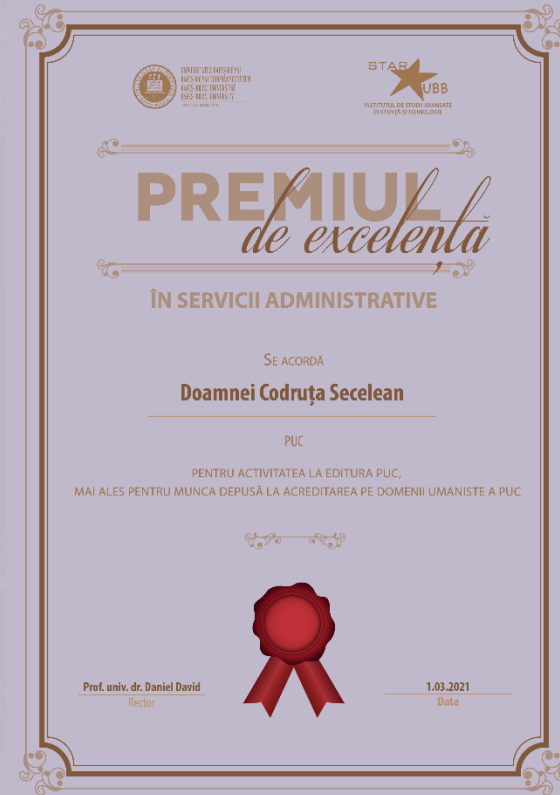
Codruța SECELEAN PUC