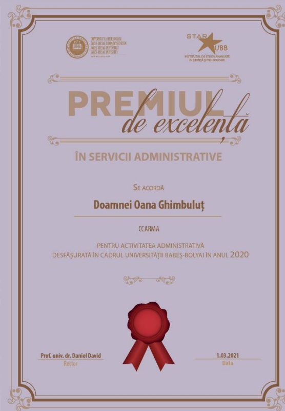
Oana GHIMBULUȚ CCARMA