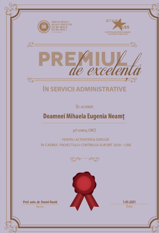
Mihaela Eugenia NEAMȚ Șef-Centru, CMCS